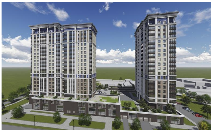
Со стороны ул. Верхняя Первомайская