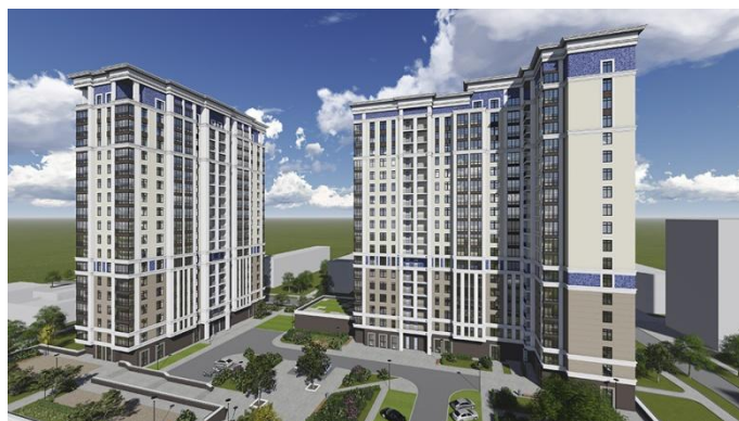
Двор в сторону ул. Верхняя Первомайская