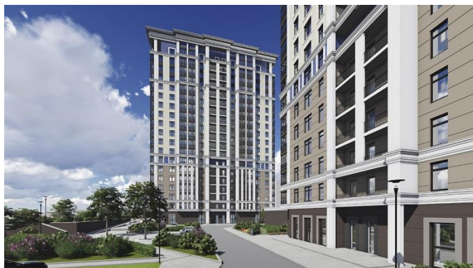
Со стороны ул. Никитинская