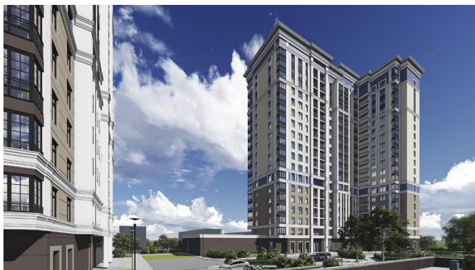
Пересечение ул. Верхняя Первомайская и ул. Никитинская